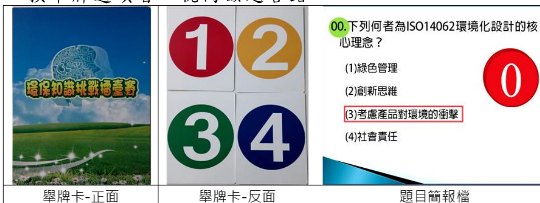
圖 1. PK 賽數字舉牌及題目簡報

十一、司儀宣讀題目後唸出「請準備」，參賽者手持選定牌子但不舉起，待司儀唸出「3、2、1，請舉牌」時，全體參賽者必須同時將牌子舉起至胸前高度，未舉牌或更換舉牌選項者，視同該題答錯。