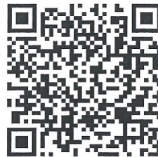
過往六福永續獎影片