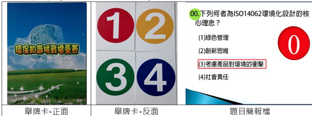
圖 1. PK 賽數字舉牌及題目簡報

十一、司儀宣讀題目後唸出「請準備」，參賽者手持選定牌子但不舉起，待司儀唸出「3、2、1，請舉牌」時，全體參賽者必須同時將牌子舉起至胸前高度，未舉牌或更換舉牌選項者，視同該題答錯。