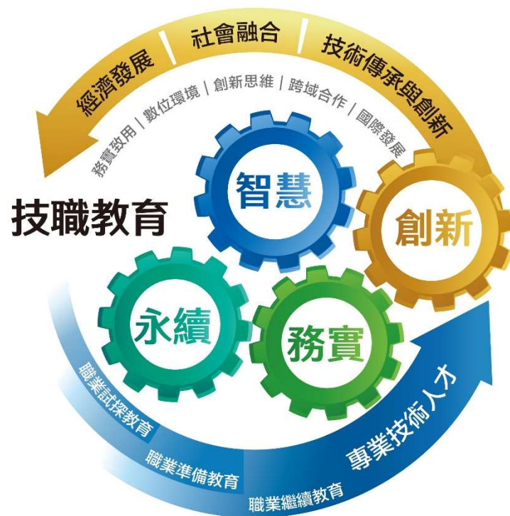
技術及職業教育綱領核心概念圖

綜上，本綱領以「建構務實、創新、智慧及永續之技職教育」為願景，並以「前瞻擘劃技職教育人才培育」、「擴大社會資源投入技職教育」及「加速創建技職教育生態系」為目標，俾回應內外部挑戰與趨勢，結合學校與政府、產業、公協會、訓練機構及非營利組織之資源，透過職業試探教育、職業準備教育及職業繼續教育之實施，致力於讓技職教育成為技術傳承與創新、國家經濟發展及社會融合之重要支柱；本綱領核心概念如圖所示。