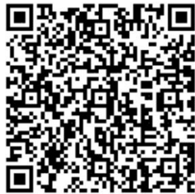
【公共管理實踐專題】

※一律網路報名，請掃描下方 QR-code： 即日起至民國 113 年 3 月 14 日止 (15 人成班，30 人額滿，成班後通知繳費)