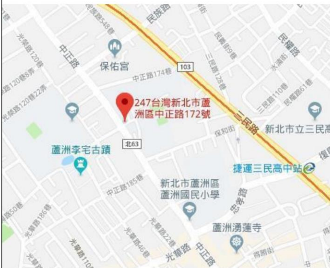
國立空中大學位置圖