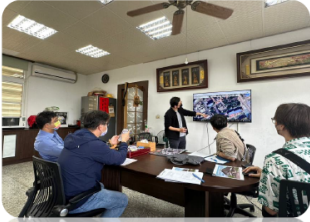
與恆春國中張校長討論